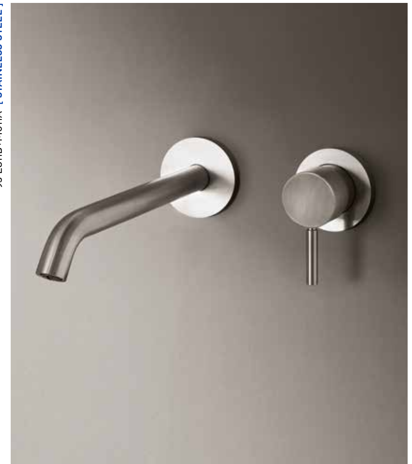
93 E811B+M011A [ STAINLESS STEEL ]