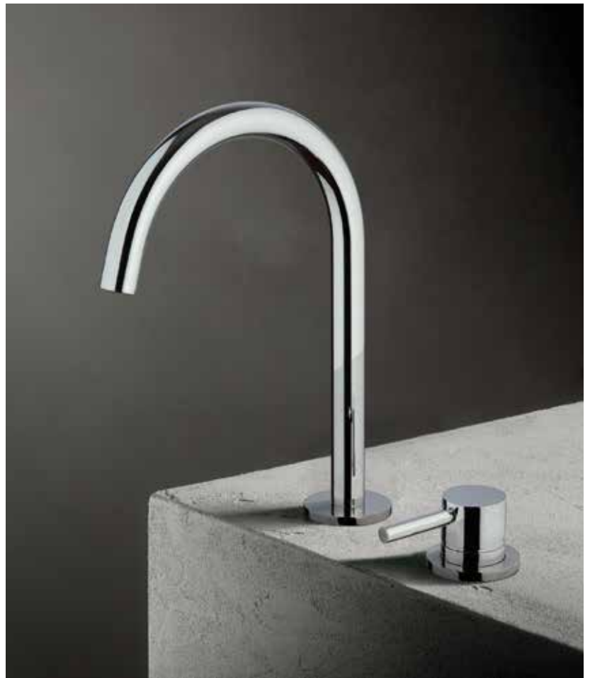
02 E895 / 02 8436