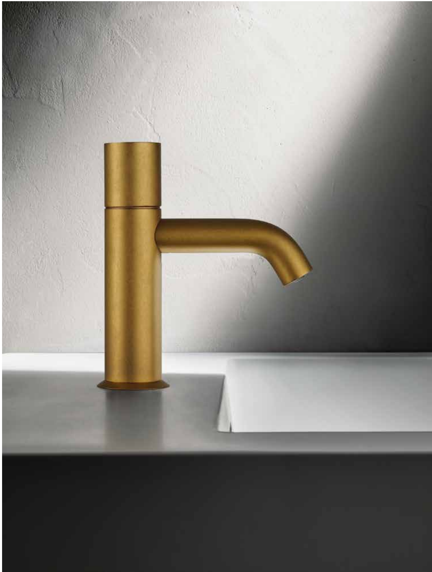
Q7 E904WF [ PURE BRASS PVD ]