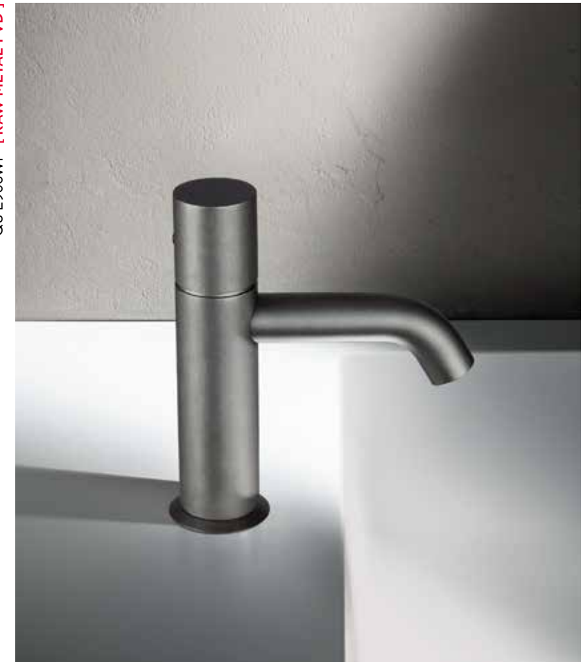
Q8 E906WF [ RAW METAL PVD ]