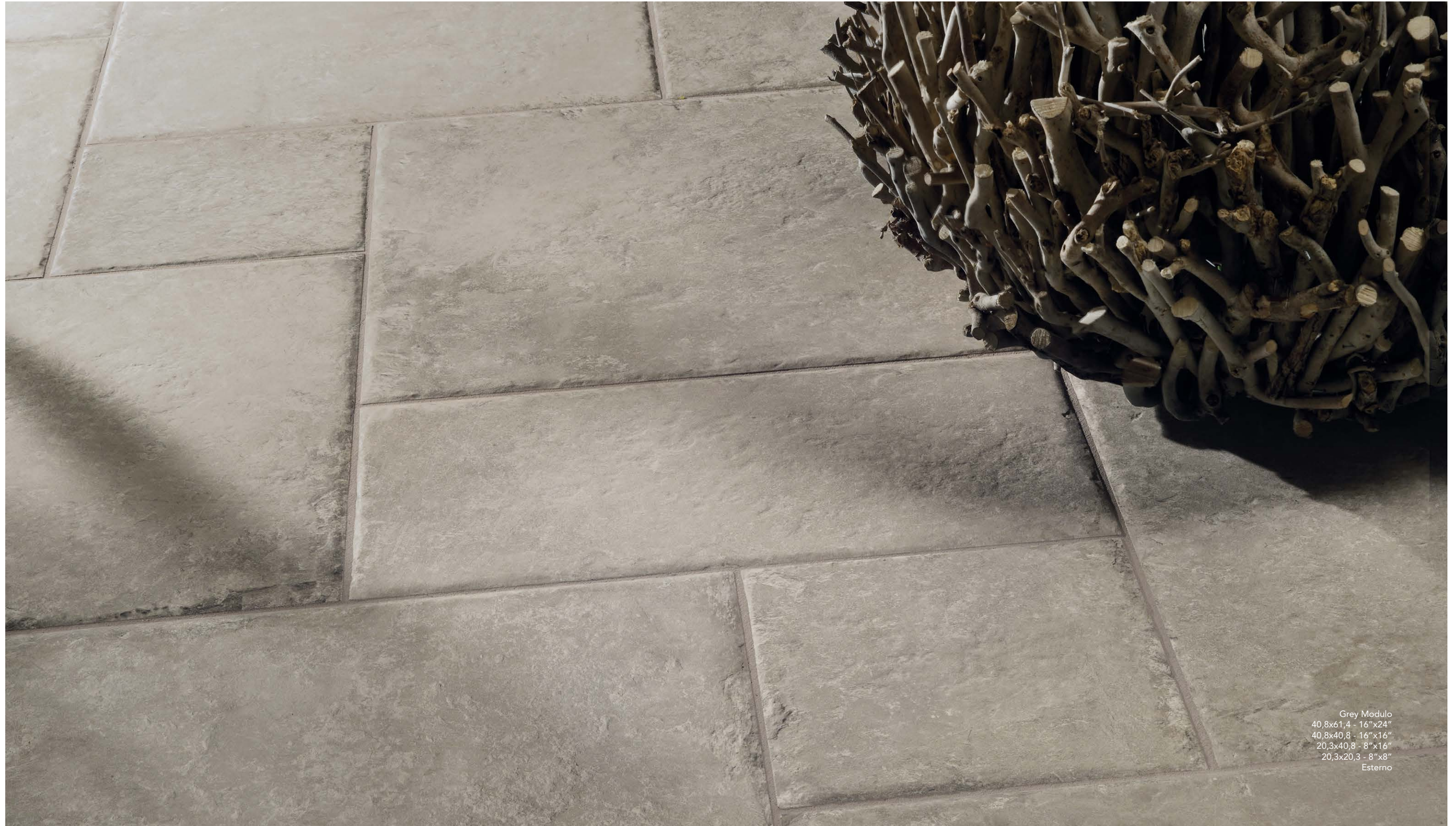
Grey Modulo 40,8x61,4 - 16"x24" 40,8x40,8 - 16"x16" 20,3x40,8 - 8"x16" 20,3x20,3 - 8"x8" Esterno