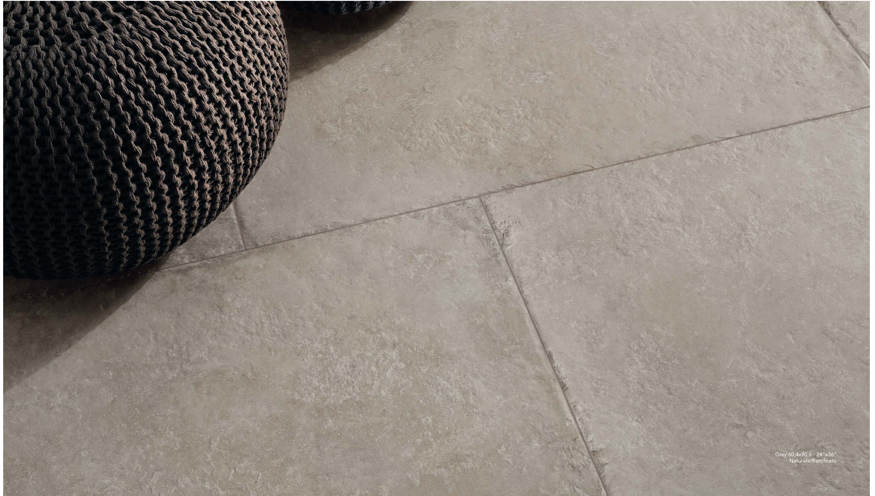
Grey 60,4x90,6 - 24"x36" Naturale/Rettificato