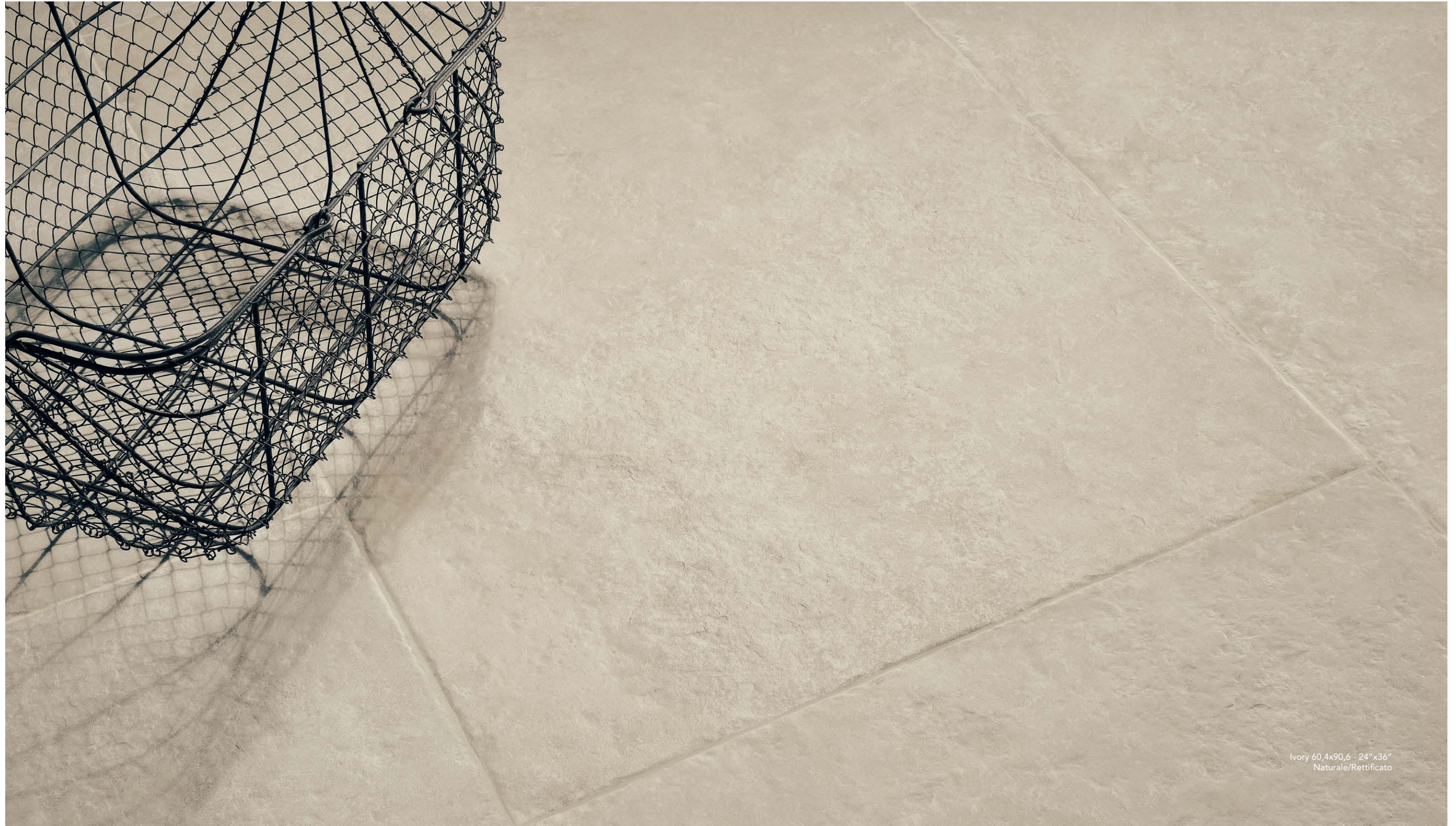
Ivory 60,4x90,6 - 24"x36" Naturale/Rettificato