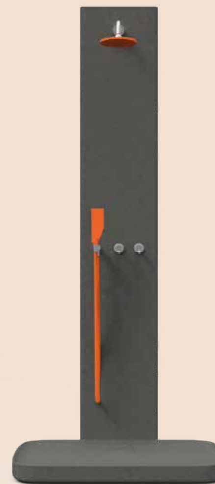
Kaa Soffione e doccia/ Shower head and hand-held shower Giulio Gianturco – 2003

Kaa shower head and hand-held shower made of anallergic silicone rubber that change shape with the increase of water pressure. Available in orange and grey, they give an accent of irony, informality and color to the environment with their light, soft and elastic material.