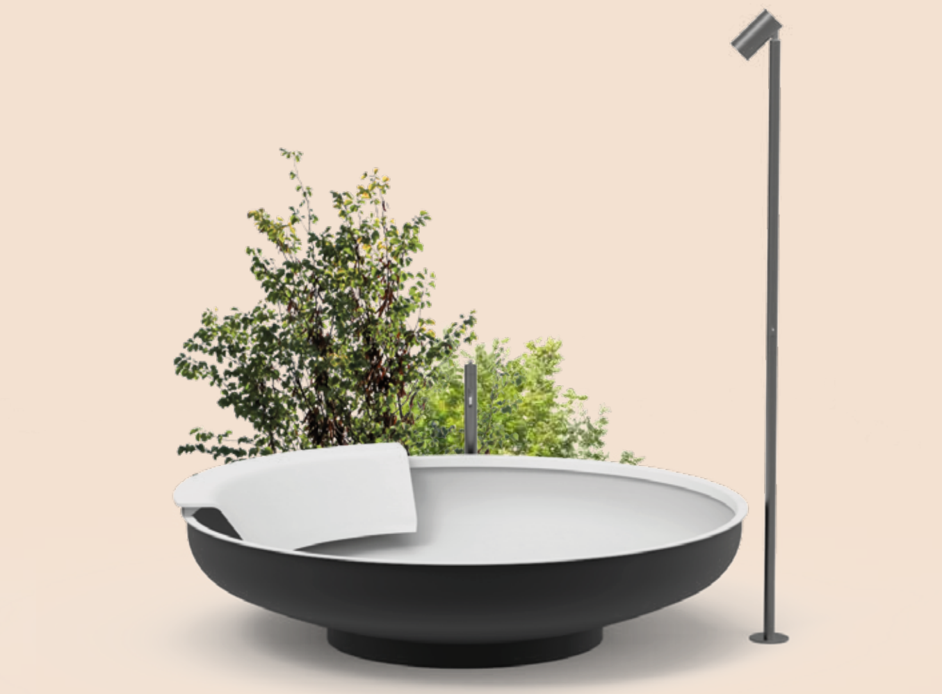
Ufo Vasca/ Bathtub Benedini Associati - 2002

The Ufo bathtub surprises and enhances every context in which it is featured and finds the perfect location both indoor and outdoor. At ease on a terrace as in a garden, its large stainless steel disk has a bicoloured finish with white inner side and dark grey outside, with one or two backrests in white Cristalplant® outdoor.