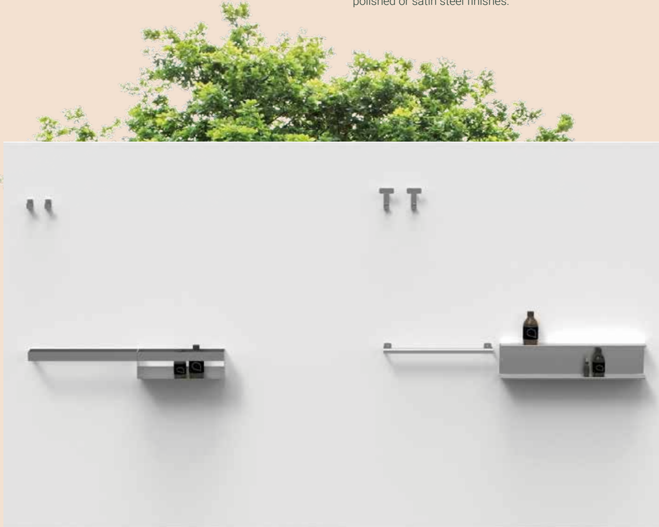
369 Accessori/ Accessories Benedini Associati - 2004

A full range of accessories realised in stainless steel (AISI 304) with satin or polished finish. Designed to satisfy any possible installation and functional requirement, the series is suitable also for outdoor spaces.