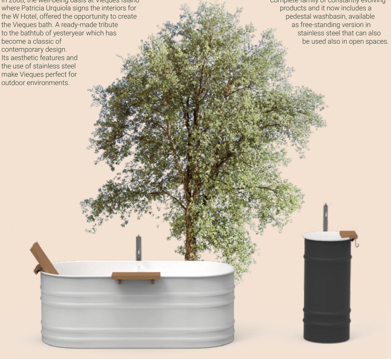
Vieques Vasca/ Bathtub Patricia Urquiola - 2008

In 2008, the well-being oasis at Vieques Island where Patricia Urquiola signs the interiors for the W Hotel, offered the opportunity to create the Vieques bath. A ready-made tribute to the bathtub of yesteryear which has become a classic of contemporary design. Its aesthetic features and the use of stainless steel make Vieques perfect for outdoor environments.