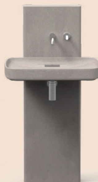
Petra Petra – Lavabo/ Washbasin, Colonna/ Column, Piano/ Top Diego Vencato, Marco Merendi – 2018

The entire Petra collection is inspired by the soft and natural finish of the Cementoskin®. Water flows on smooth surfaces, gently inclined like those of a stone, polished by elements of nature. The collection consists of: a washbasin, available in a countertop or freestanding version, fixed to the wall or to a monolithic column, two shower trays, a shower column, a countertop and a hose reel.