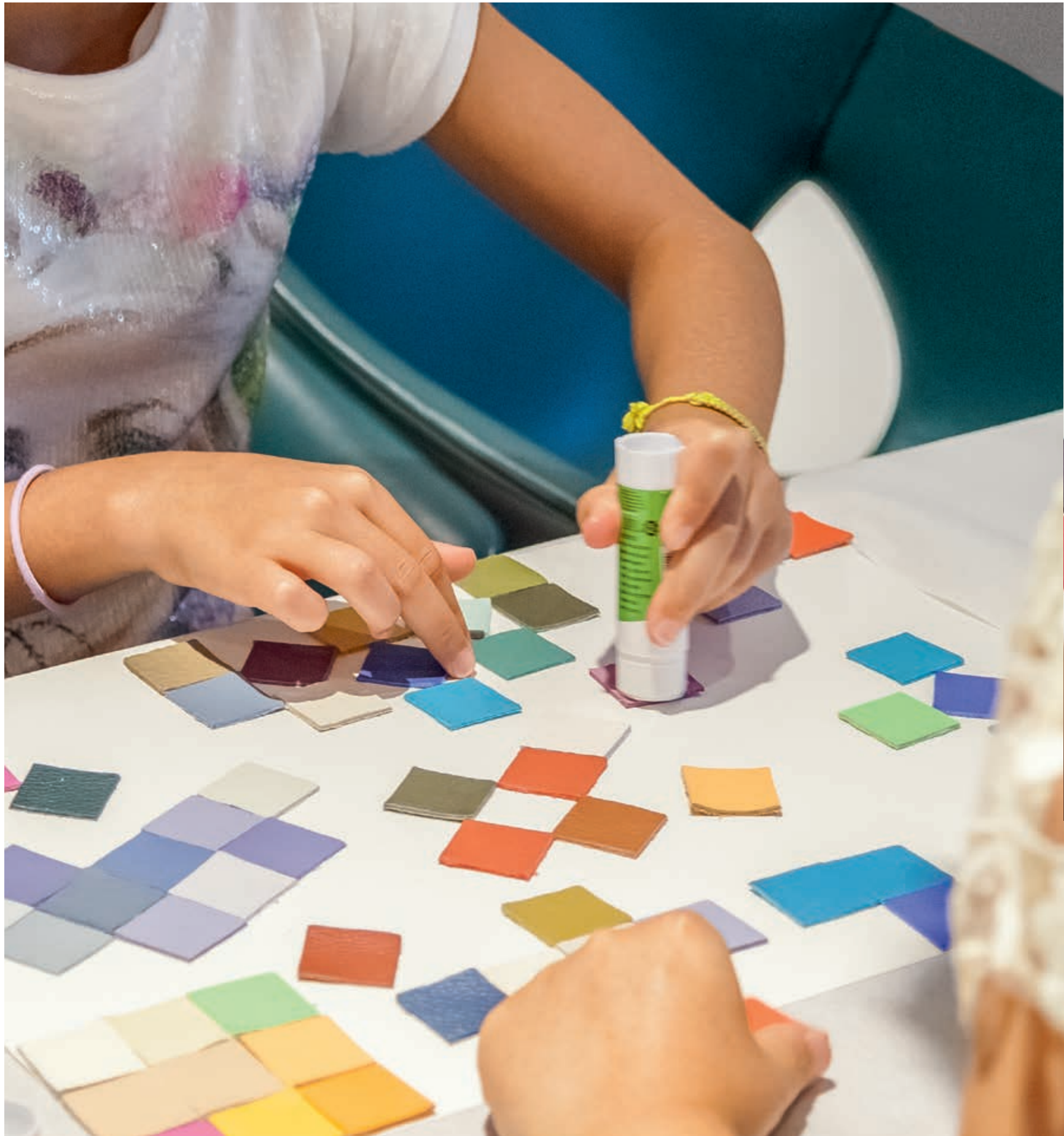
↑ ↗ Children's creativity at Poltrona Frau Museum. Coloured leather samples matching