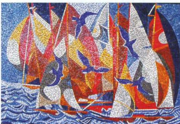
Exemple de Fresque en mosaïque taillée personnalisée.