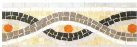
Naxos LE 05 11