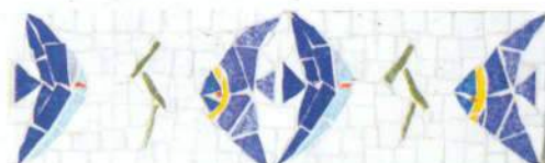
Kimolos LE 10 11

Pour des raisons techniques d'impression, la reproduction des coloris ne peut être absolument exacte. For reasons of a technical nature, the colours of the tiles cannot be reproduced with complete exactitude in print.