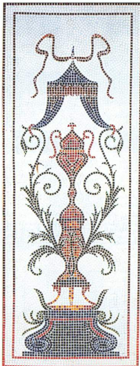
Micro Mosaïque et Impromptus.