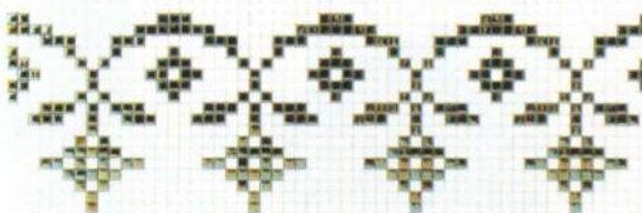
Campanile CE 85 01