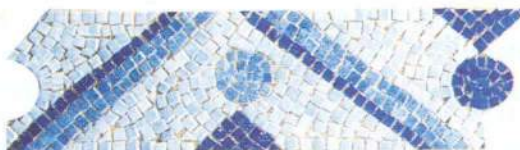
Poros LE 20 11