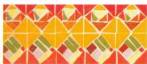
Kéa LE 00 11