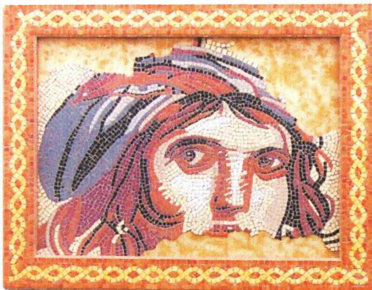
Fresque en Impromptus.