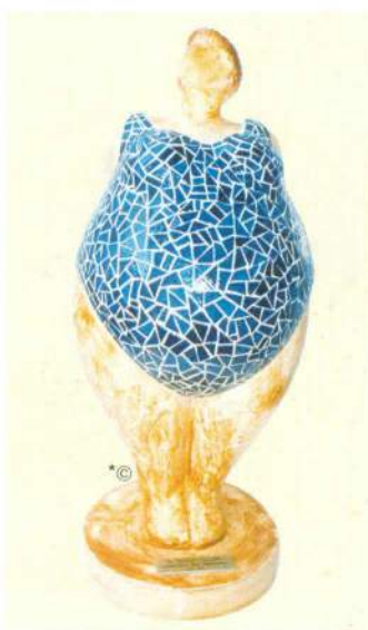
Mosaïque taillée. ©