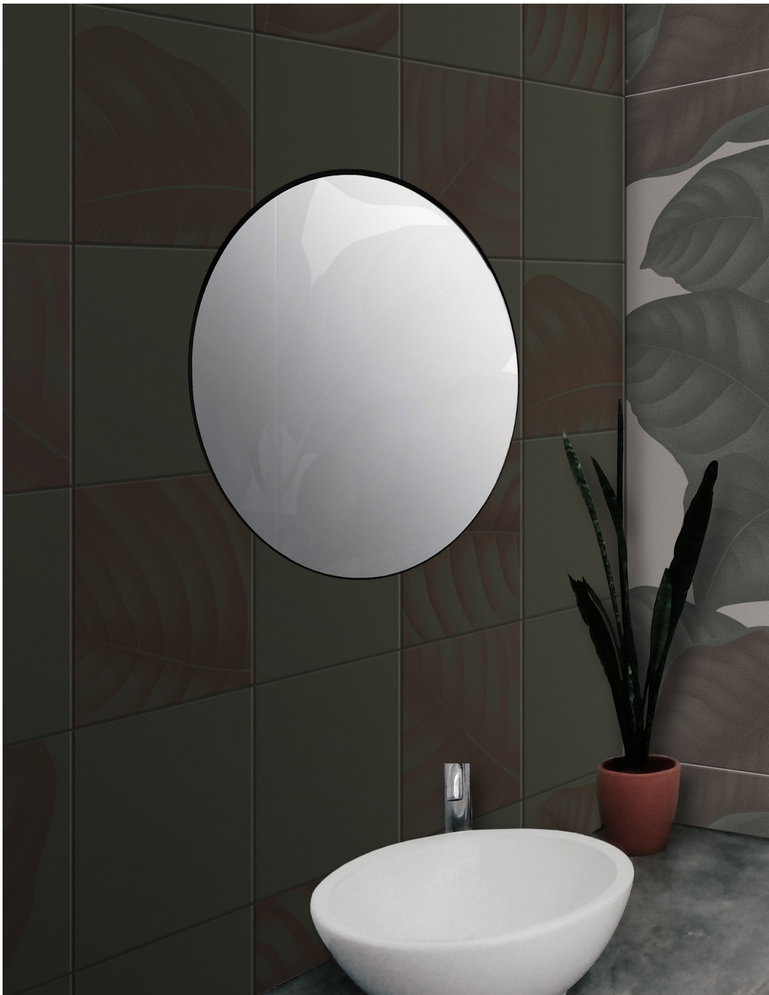
BO3030E ERBOLARIO 30x30 | 12"x12" | BO60120LC LEAVES CALCE | 60x120 | 24"x48"