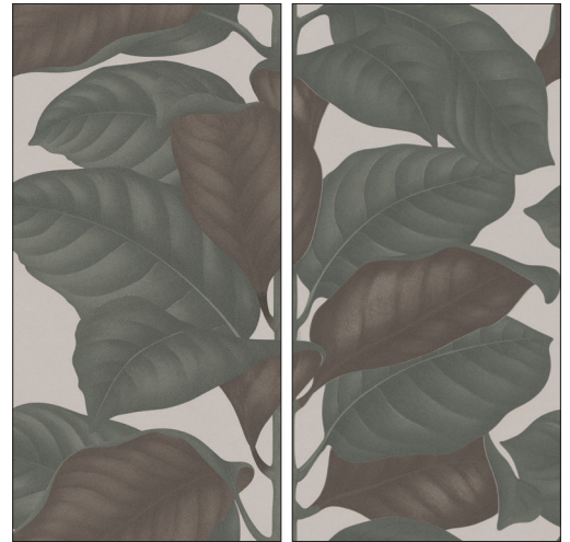
BO60120LEC LEAVES CALCE 60x120 | 24"x48"