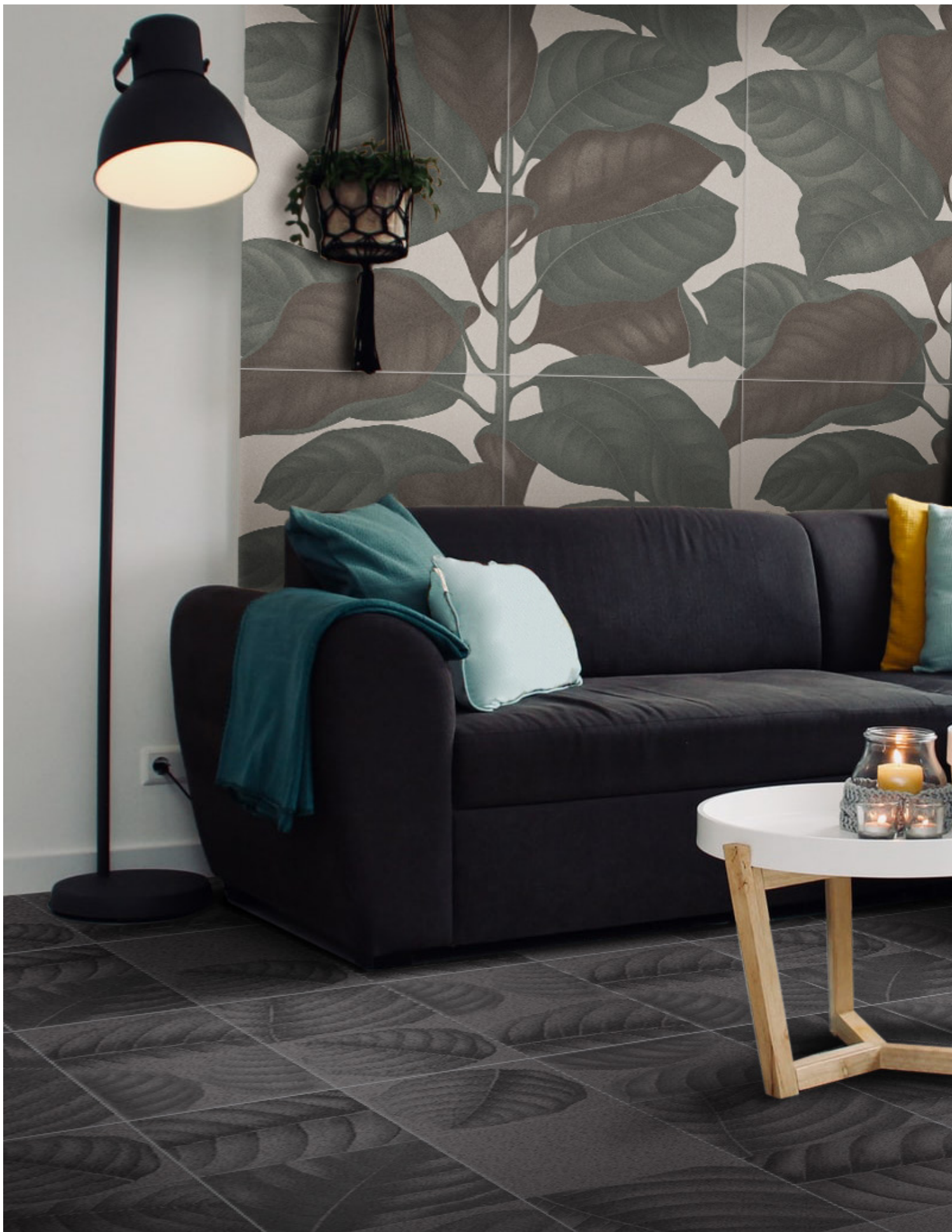
BO3030L LAVA | BO3030LL LYMPH LAVA | 30x30 | 12"x12" | BO60120LC LEAVES CALCE | 60x120 | 24"x48"