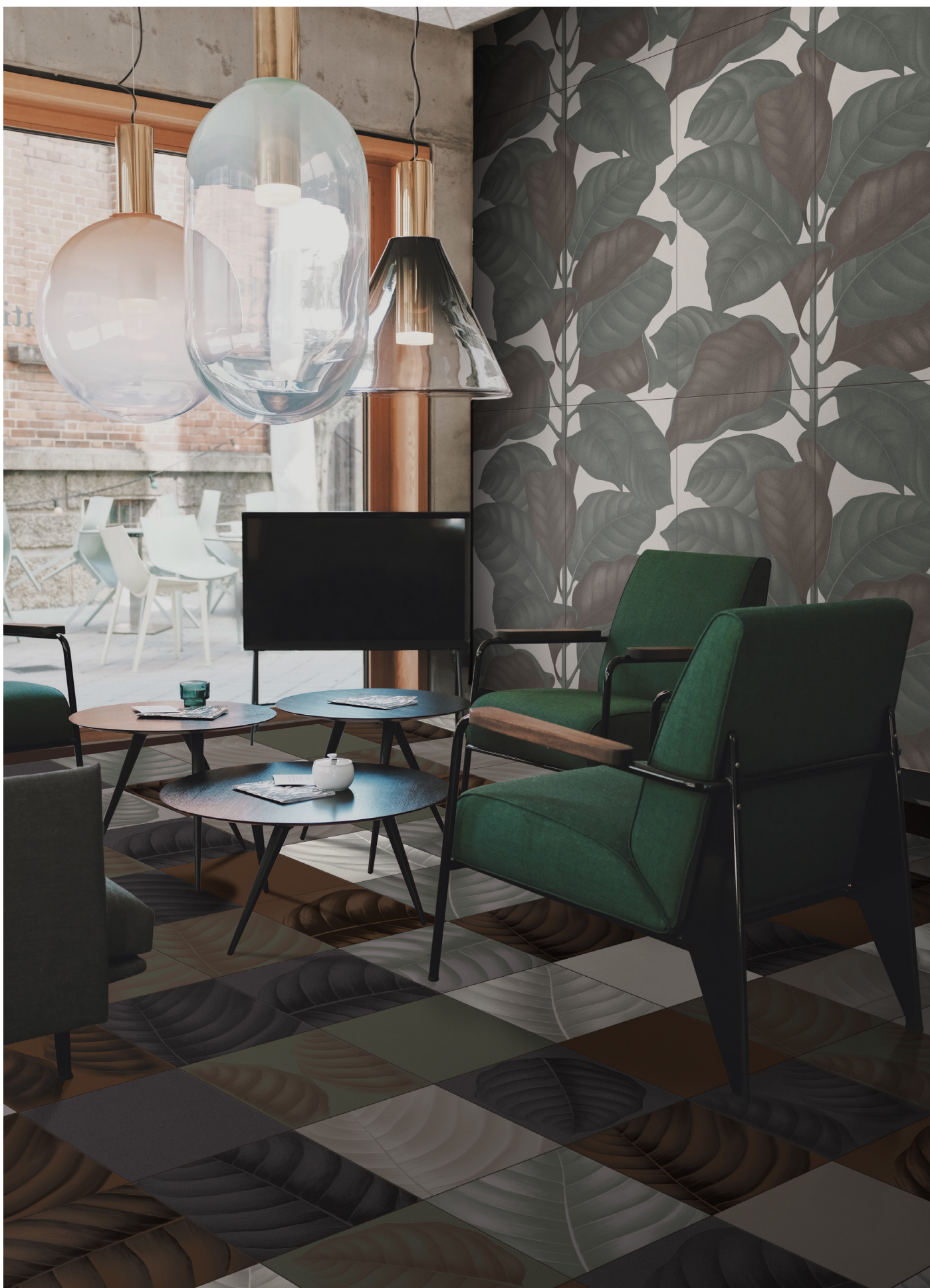
BO3030C CALCE | BO3030CE CEMENTO | BO3030F FANGO | BO3030E ERBOLARIO | B3030T TERRACOTTA | B3030L LAVA | BO3030LC LYMPH CALCE | BO3030LCE LYMPH CEMENTO | BO3030LF LYMPH FANGO | BO3030LE LYMPH ERBOLARIO | BO3030LT LYMPH TERRACOTTA | BO3030LL LYMPH LAVA 30x30 | 12"x12" | BO60120LEC LEAVES CALCE | 60x120 | 24"x48"