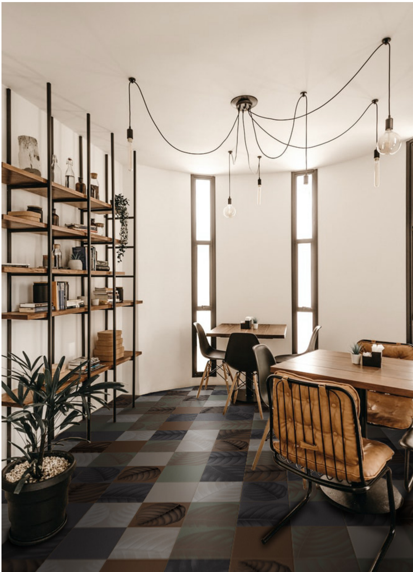
BO3030L LAVA | BO3030T TERRACOTTA | BO3030F FANGO | BO3030E ERBOLARIO | BO3030LL LYMPH LAVA | BO3030LT LYMPH TERRACOTTA BO3030LF LYMPH FANGO | BO3030LE LYMPH ERBOLARIO | 30x30 | 12"x12"