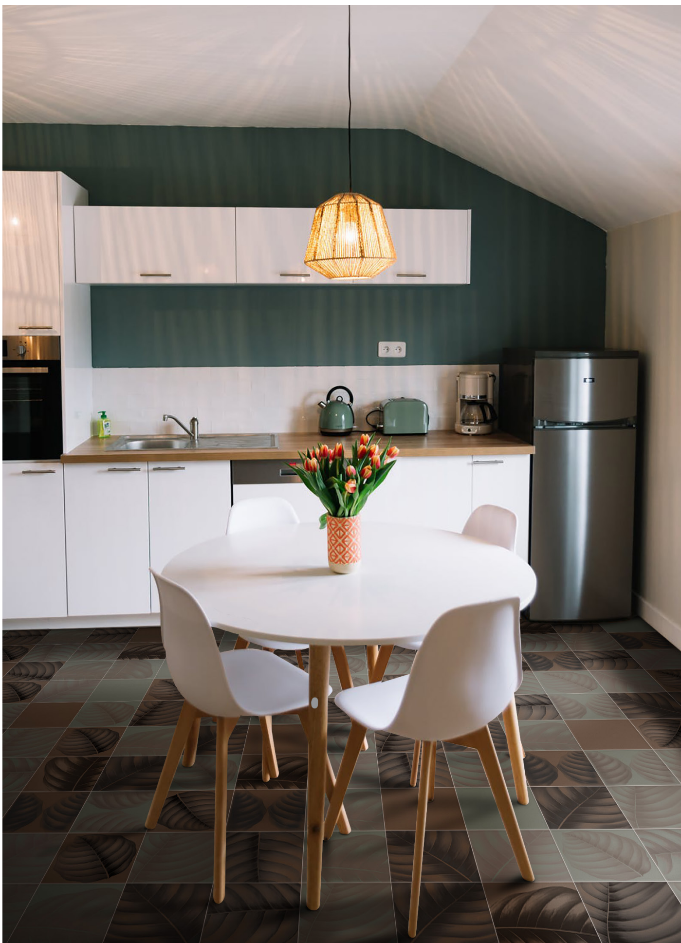
BO3030T TERRACOTTA | BO3030E ERBOLARIO | BO3030LT LYMPH TERRACOTTA | BO3030LE LYMPH ERBOLARIO | 30x30 | 12"x12"