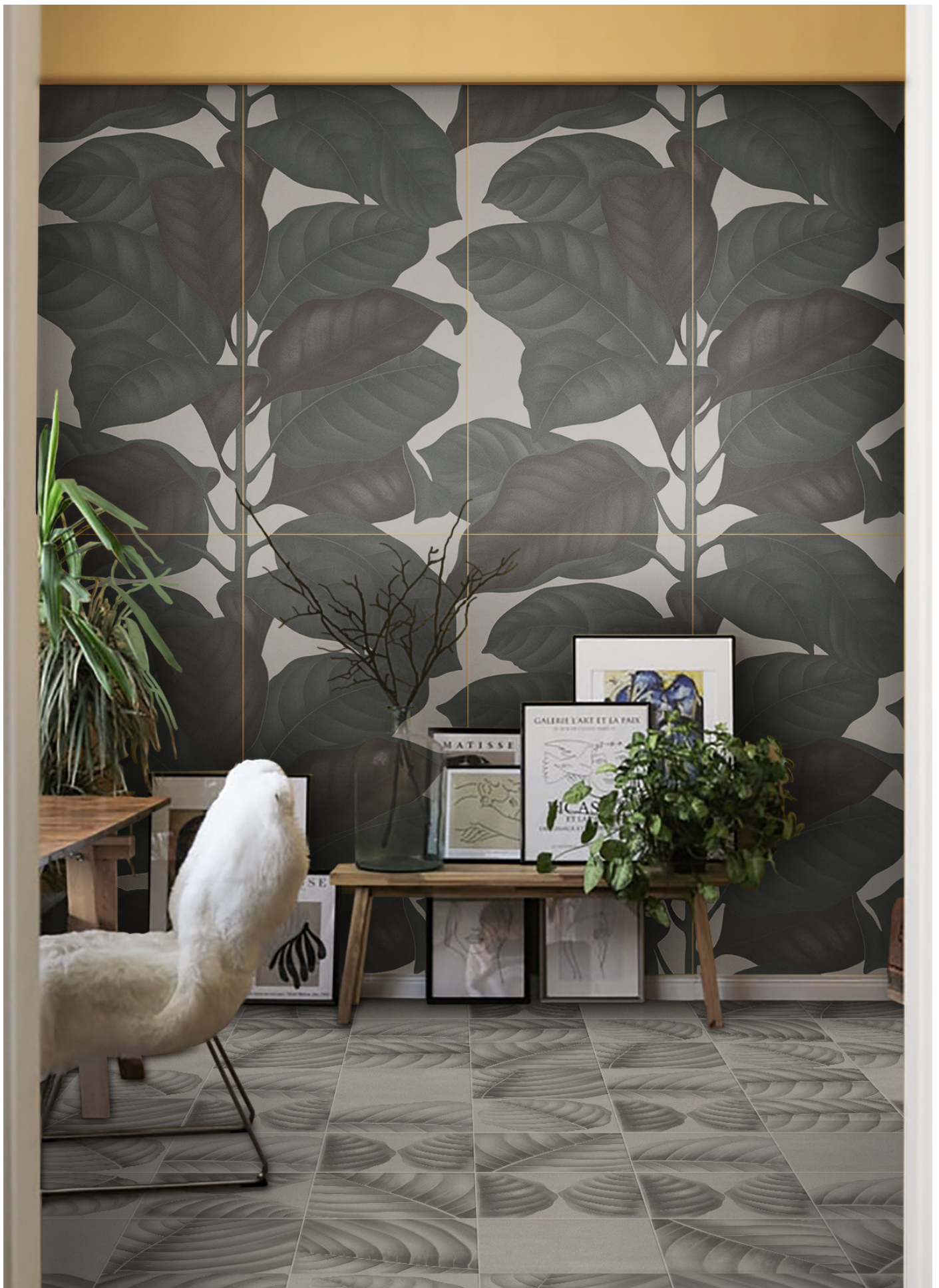
BO3030C CALCE | BO3030LC LYMPH CALCE | 30x30 | 12"x12" | BO60120LC LEAVES CALCE | 60x120 | 24"x48"