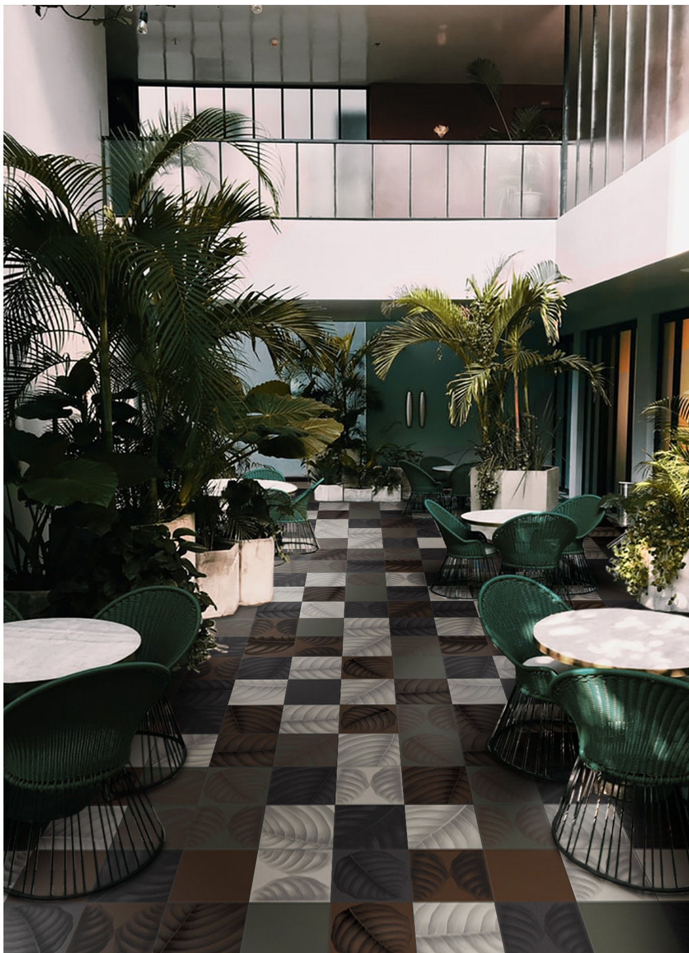
BO3030C CALCE | BO3030L LAVA | BO3030T TERRACOTTA | BO3030E ERBOLARIO | BO3030LC LYMPH CALCE | BO3030LL LYMPH LAVA BO3030LT LYMPH TERRACOTTA | BO3030LE LYMPH ERBOLARIO | 30x30 | 12"x12"