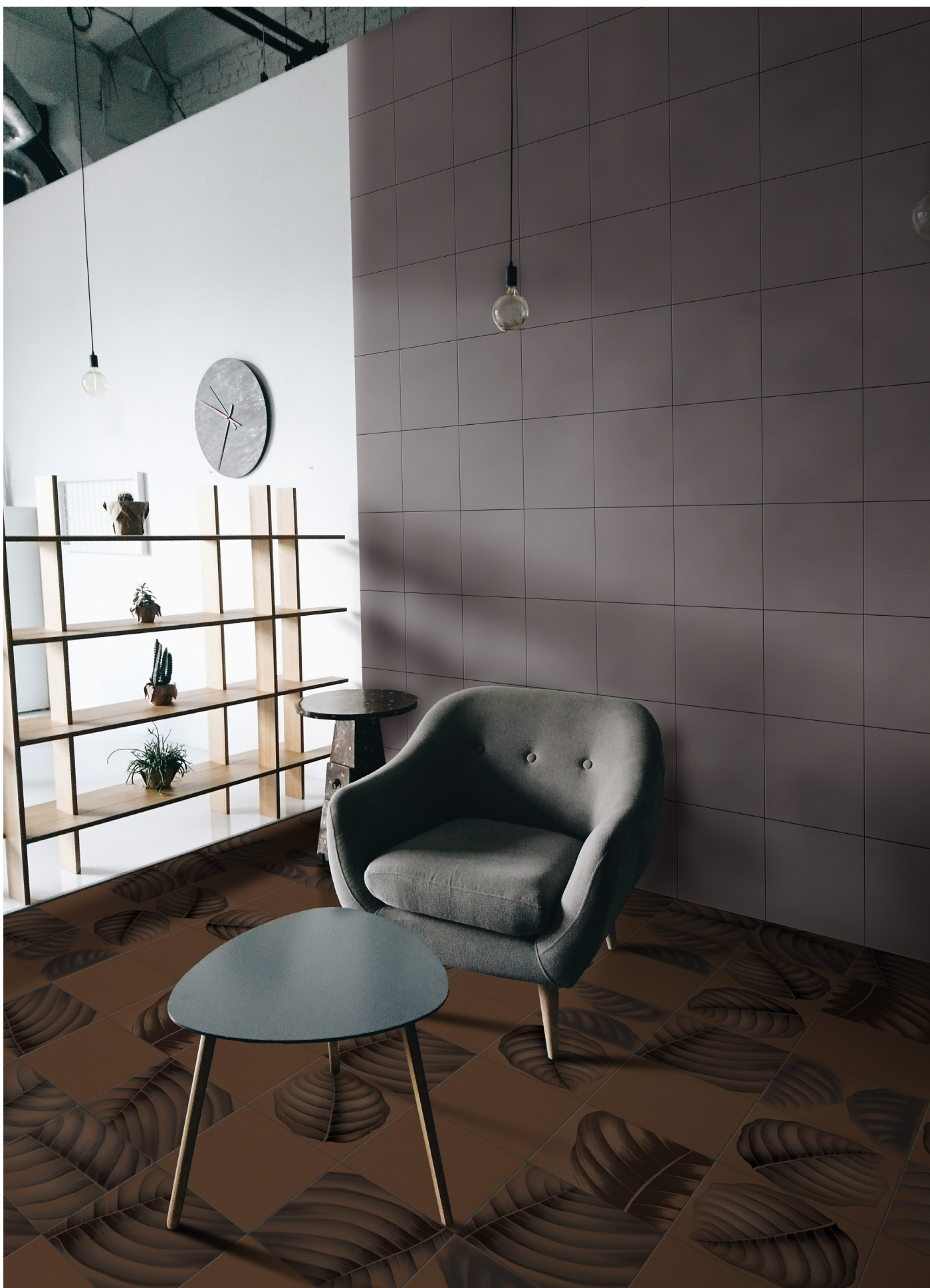
BO3030T TERRACOTTA | BO3030CE CEMENTO | BO3030LT LYMPH TERRACOTTA | 30x30 | 12"x12"