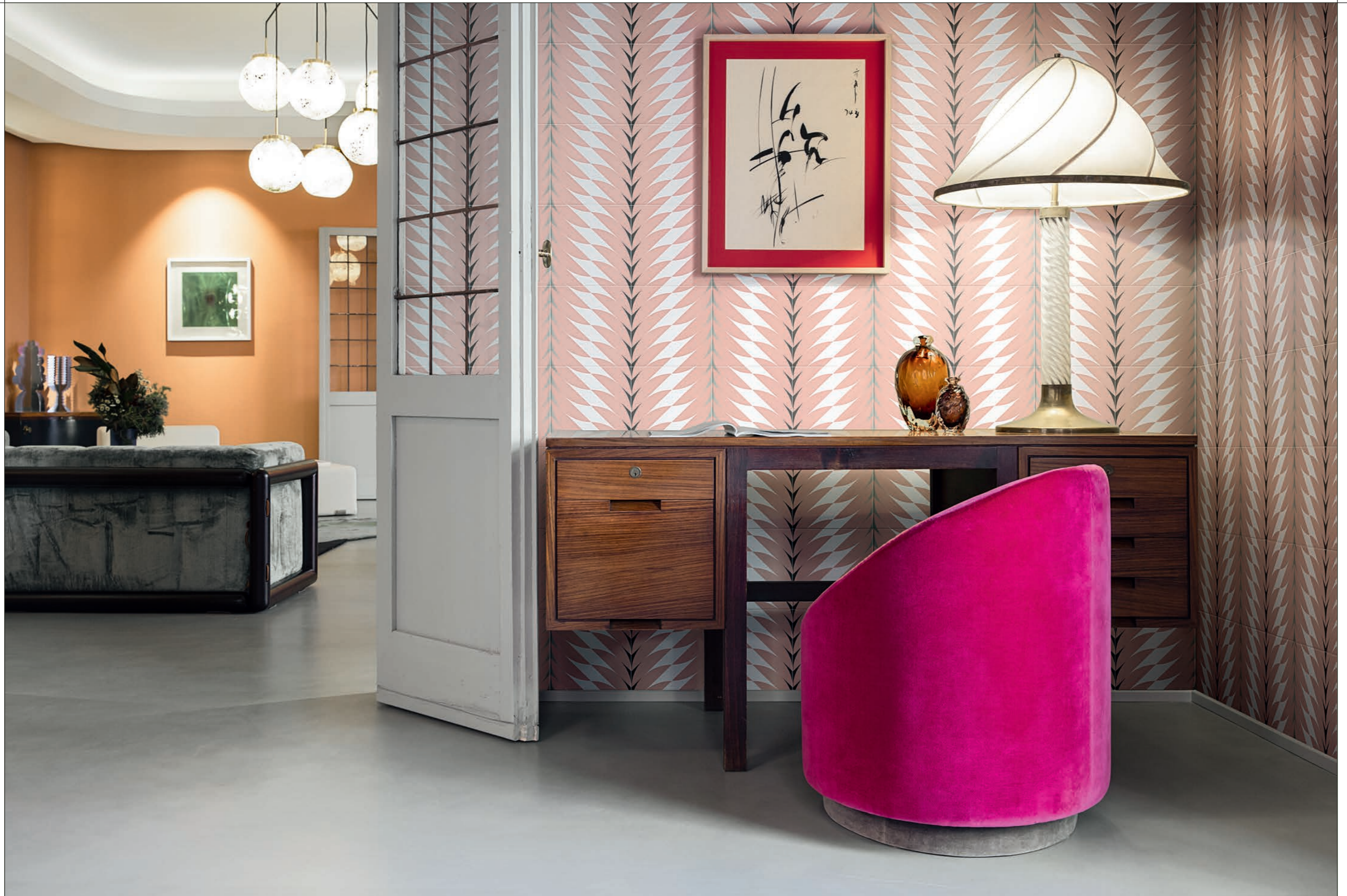
LIVING, FLEURS 3A-3B Rivestimento posa a campo pieno / Covering, all over layout