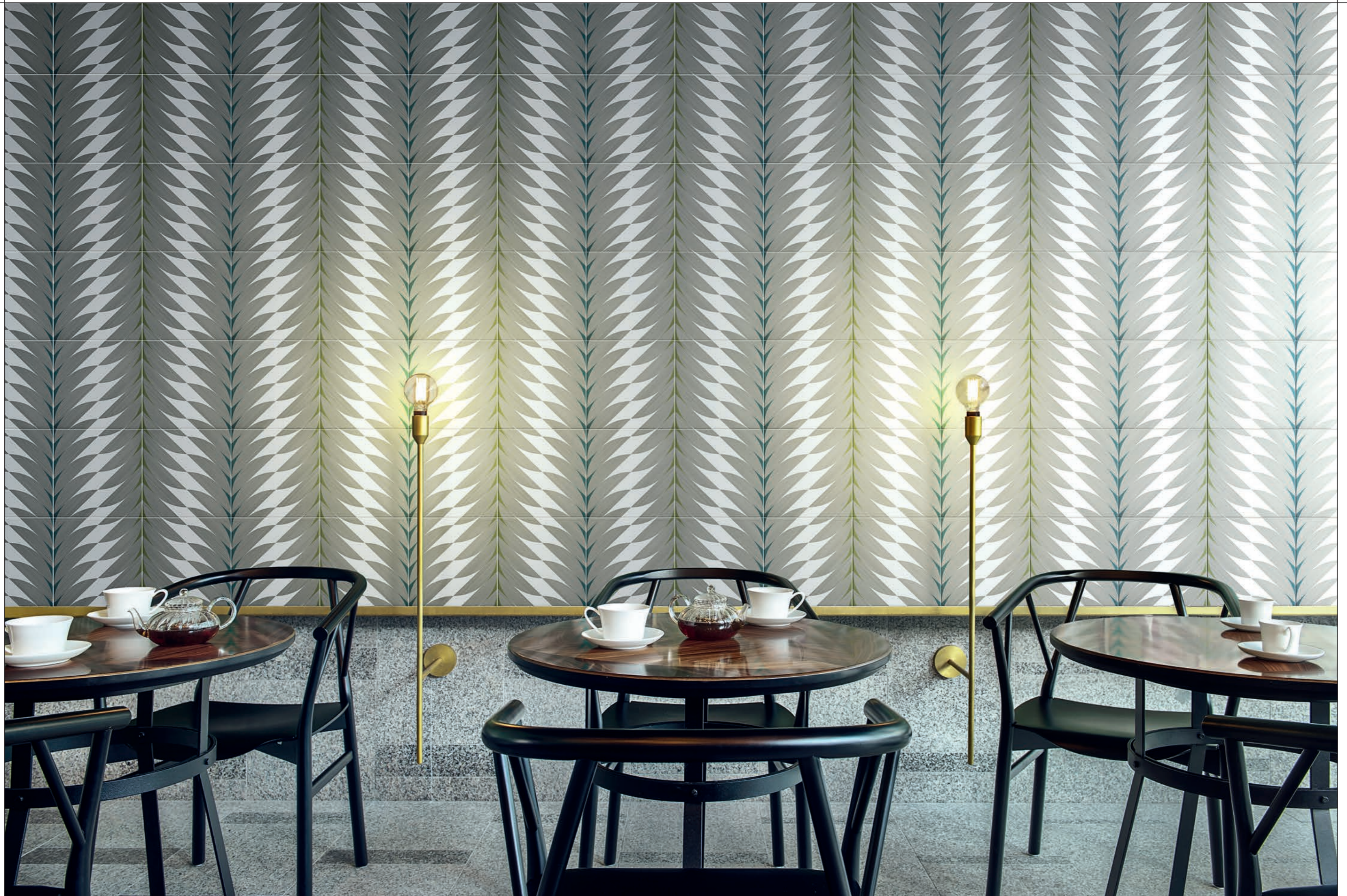
CONTRACT, FLEURS 4A-4B Rivestimento posa a campo pieno / Covering, all over layout