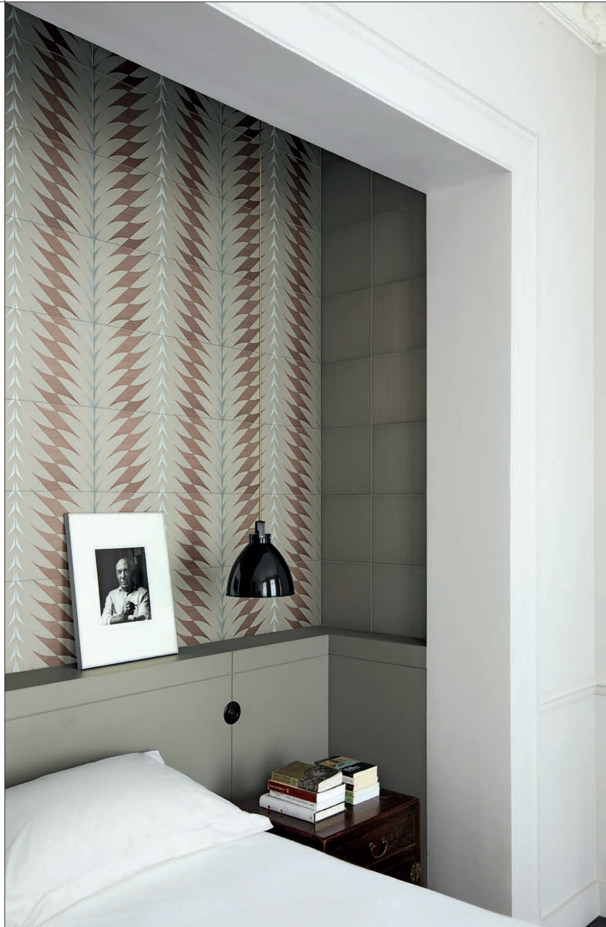
CONTRACT, FLEURS 2A-2B-2F Rivestimento posa a campo pieno / Covering, all over layout