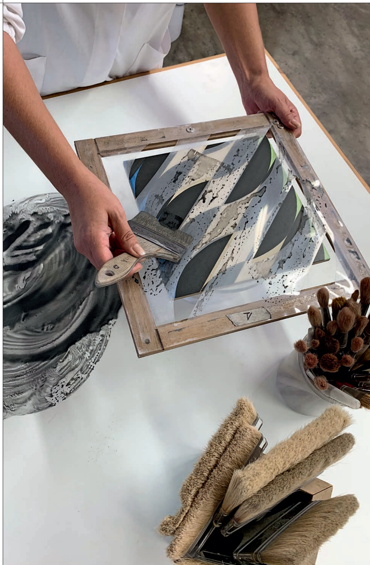
PENNELATO A MANO / HAND PAINTED