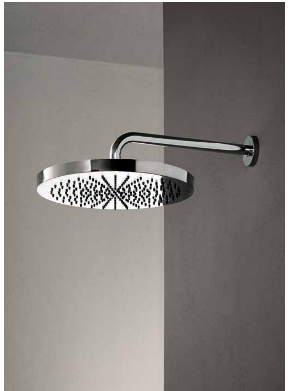
38 K073 / 02 8027