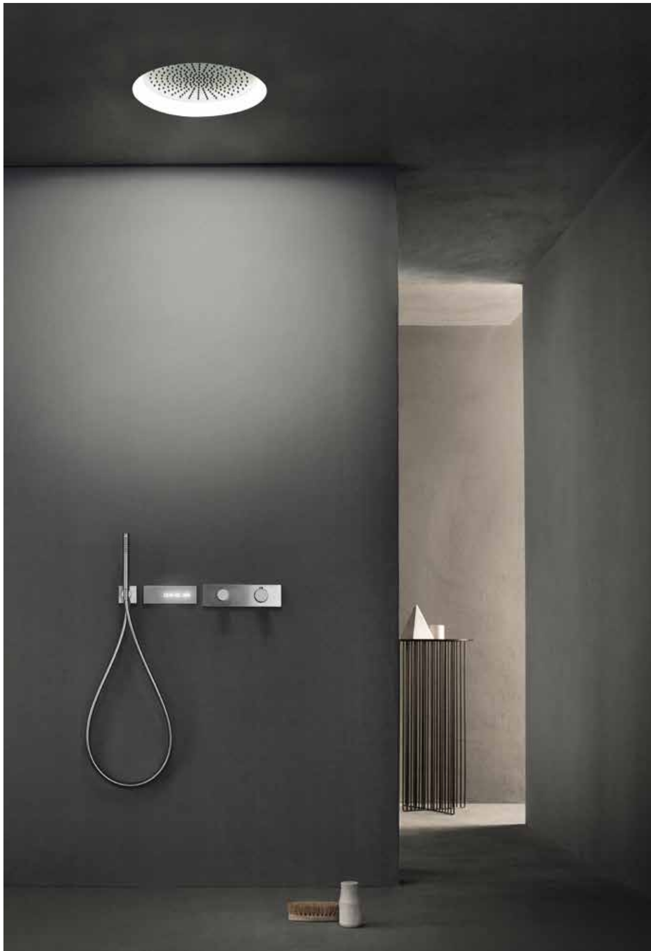
93 K061 / 93 G573B+D373A / 00 K101 / 93 8116