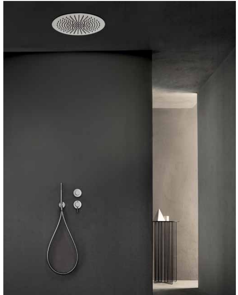
93 K072 / 93 G481B+M585A / 93 8093