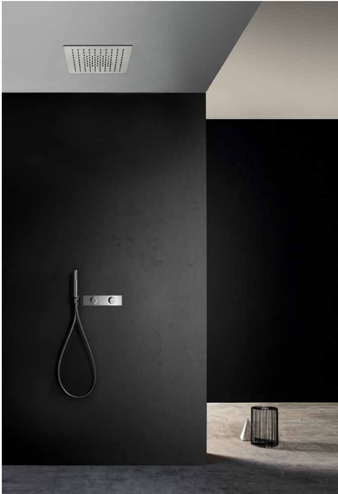
93 K052 / 93 G572B+D372A / 93 8116