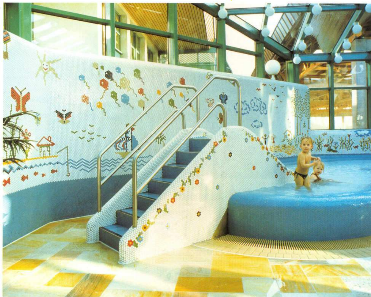
Piscine municipale, Allemagne Municipal swimming-pool, Germany