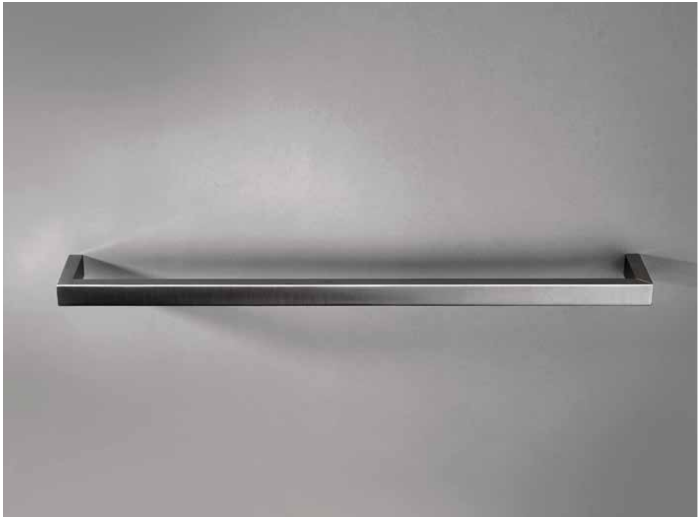
93 7711 [ STAINLESS STEEL ]