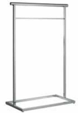
7843 Piantana portasalviette, 55 cm, da appoggio. Towel rail, 55 cm, free standing. Colonne porte-serviettes, 55 cm, à poser. Handtuchstangensäule, 55 cm, Ablagen. Peana toalleros, 55 cm, de suelo.

Finiture/ Finishing/ Finitions/ Oberfläche/ Acabados 02, 01