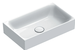
New Premium 50x30