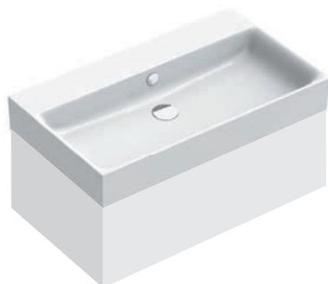
Mobile / Drawer Unit