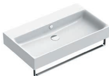
Portasalviette / Towel rail