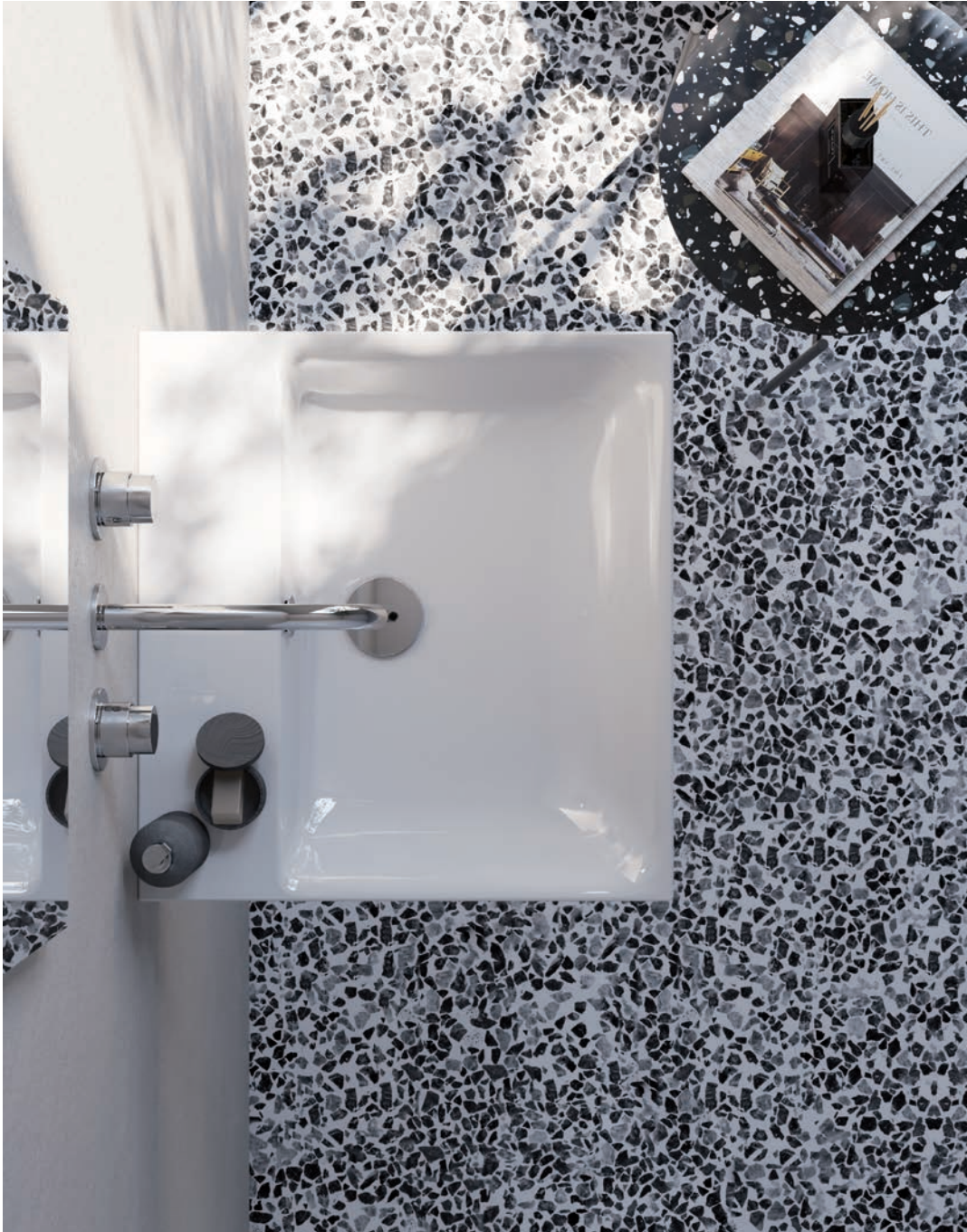
50*47 Bianco lucido Glossy white