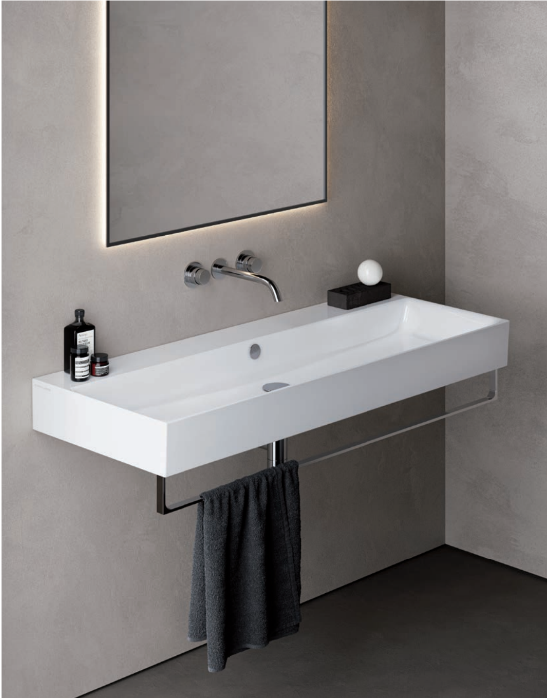
120*47 Bianco lucido Glossy white