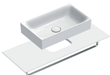
Portasalviette / Towel rail