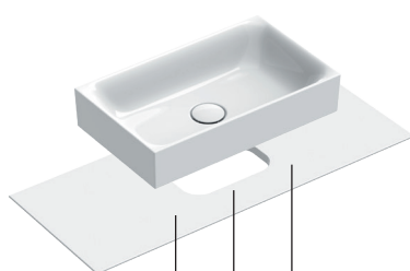
1P 2P 3P 3 Posizioni / Positioning Ceramic Top 100x40