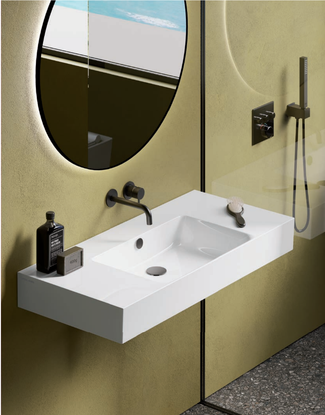
100*47 Bianco lucido Glossy white